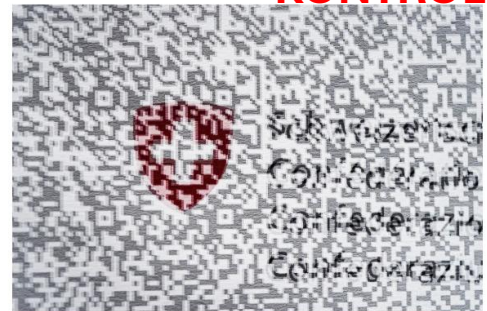
Das Narrativ von Berset und seinem Amt diente dazu, die Zertifikatspflicht zu rechtfertigen, über die Ende November 2021 abgestimmt wurde.

https://www.nzz.ch/schweiz/impf-luege-die-pfizer-studie-das-bag-und-bersets-kommunikation-id.1709398