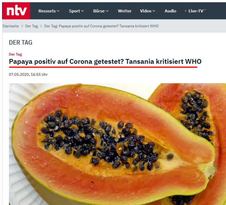
Ob die Papaya-Frucht auch Symptome zeigte, wurde nicht mitgeteilt.